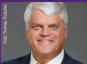
Markus Grübel Beauftragter für Religionsfreiheit, MdB/CDU, Schirmherr und Referent