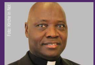
Ignatius Ayau Kaigama Erzbischof von Abuja, Nigeria